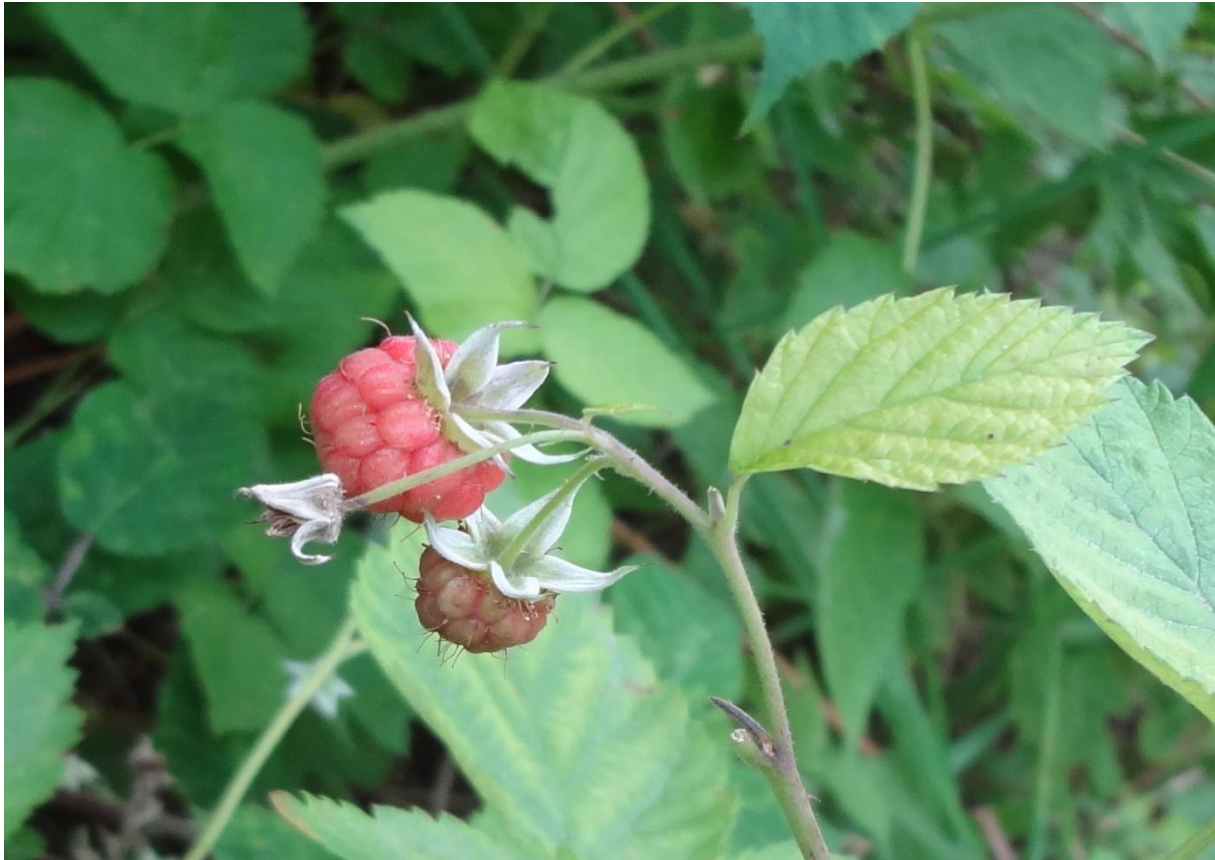
Nr. 237: Himbeere