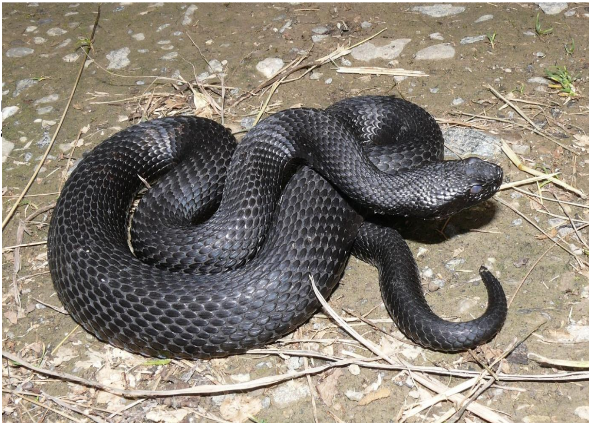
Seltene Begegnung: Aspiviper ( Vipera a. aspis ) Die milchige Trübung der Haut über den Augen zeigt die bevorstehende Häutung an. Schwärzlinge sind am Lombach häufiger als die hell gezeichnete Variante.