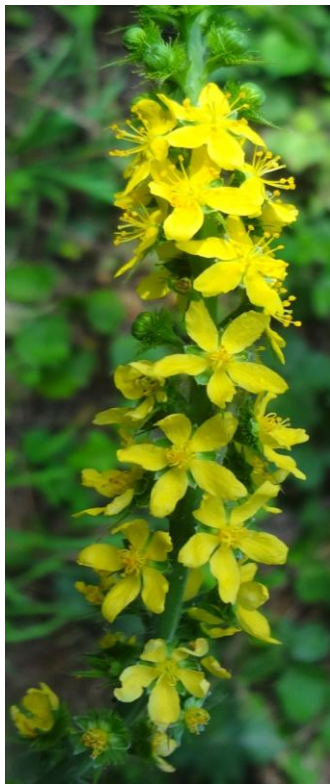
Nr. 9: Odermennig