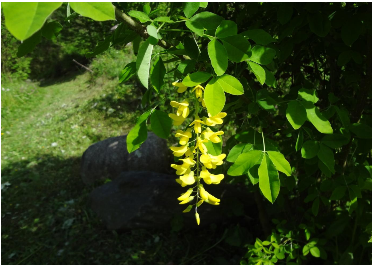
Nr. 157: Goldregen