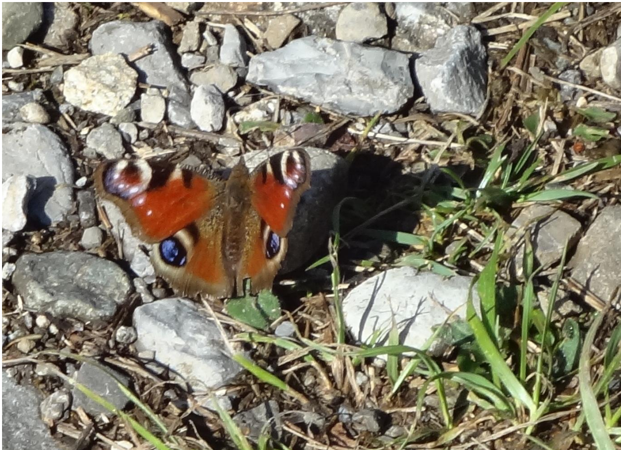
Das Tagpfauenauge ( Inachis io ) überwintert als geschlechtsreifer Vollkerf (Imago) und ist deshalb schon zeitig im Frühling zu beobachten

Und trotzdem: Der Unterlauf des Lombaches, ein sehr geschätztes und deshalb intensiv genutztes Naherholungsgebiet, überrascht den aufmerksamen Beobachter immer wieder mit neuen Erkenntnissen. Und es beweist auch, dass bei etwas Rücksicht genügend Platz vorhanden ist für Mensch, Tier und Pflanze.