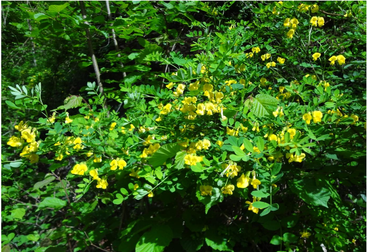
Nr. 141: Strauchwicke