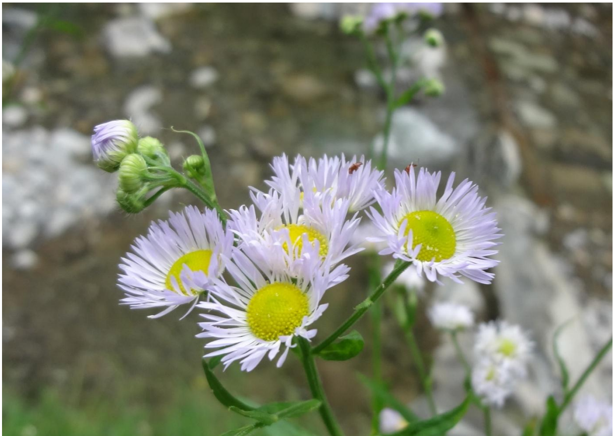
Nr. 109: Berufkraut