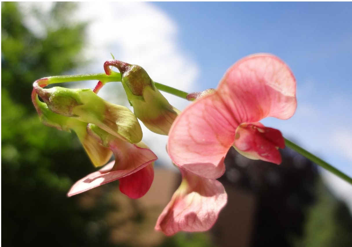
Nr. 164: Wald-Platterbse