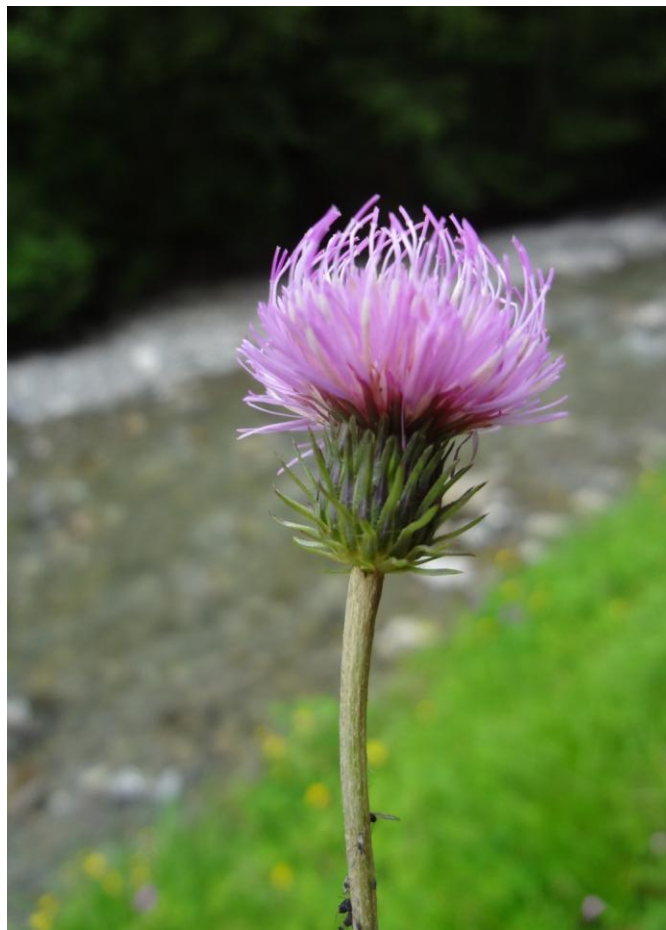
Nr. 58: Bergdistel