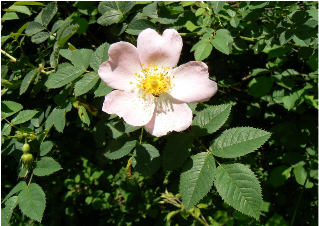
Nr. 235: Hunds-Rose