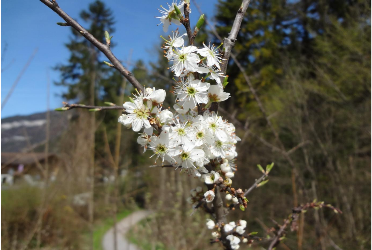
Nr. 220: Schwarzdorn