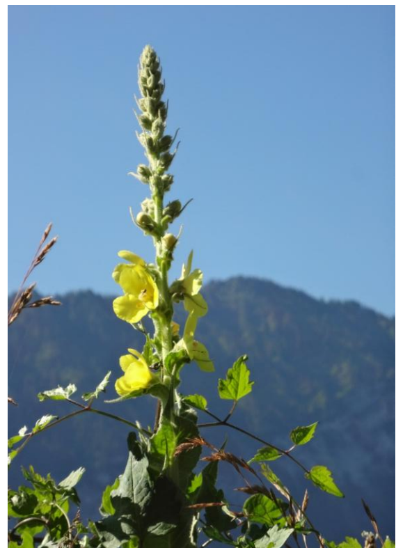
Nr. 295: Königskerze